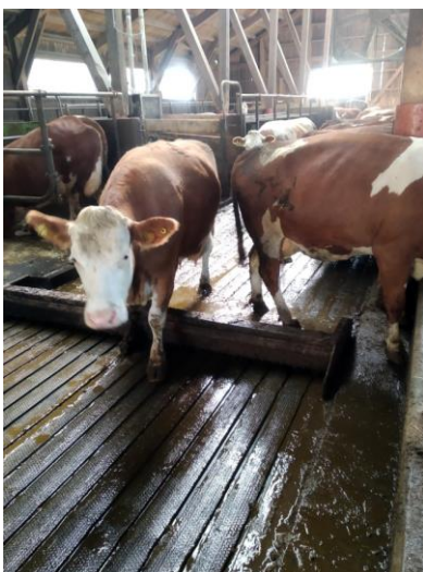
Abbildung 5: profiDRAIN und Entmistungsschieber im Praxisbetrieb in Salzburg, © tierschutzkonform