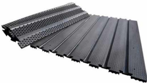
Abbildung 1: Foto profiDRAIN von KRAIBURG Elastik GmbH & Co KG, © KRAIBURG [2]

Die profiDRAIN von KRAIBURG Elastik GmbH & Co KG dient als Laufflächenbelag in Rinderställen. Die profiDRAIN ist eine Weiterentwicklung der früheren Rinnenmatte RIMA von KRAIBURG Elastik GmbH & Co KG [1]. Die profiDRAIN ist eine 30 mm dicke Laufgangmatte mit 28 mm breiten Rillen im Abstand von 12,5 cm. Die Gummimatte ist in einer Länge von 125 cm und einer variablen Breite zwischen 96 und 196 cm konzipiert und wird mit dem KRAIBURG Befestigungssystem verankert [2].