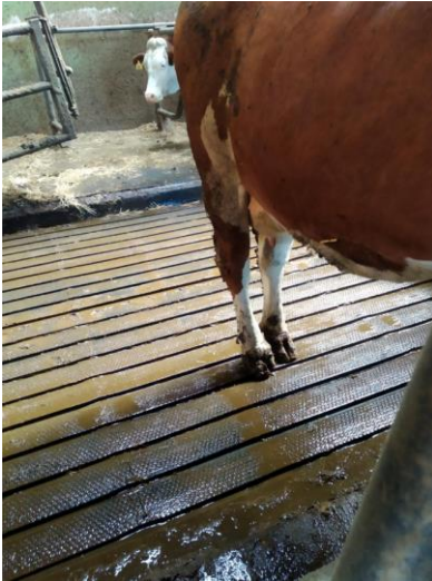
Abbildung 3: profiDRAIN und Entmistungsschieber im Praxisbetrieb in Salzburg, © tierschutzkonform