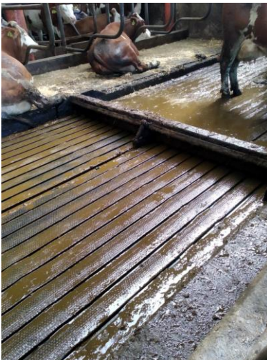
Abbildung 4: profiDRAIN und Entmistungsschieber im Praxisbetrieb in Salzburg